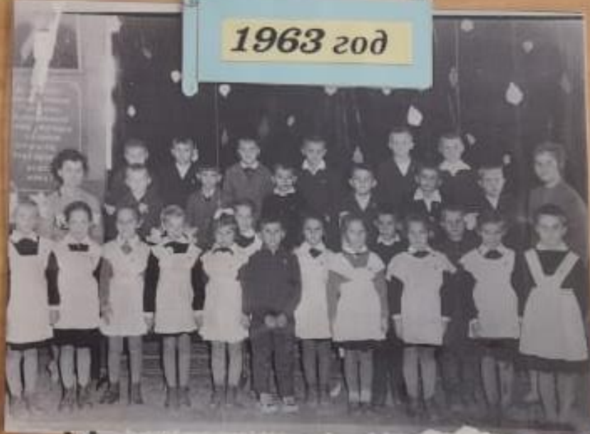
• 1963 год Привет в пионерата в старом офицерском клубе