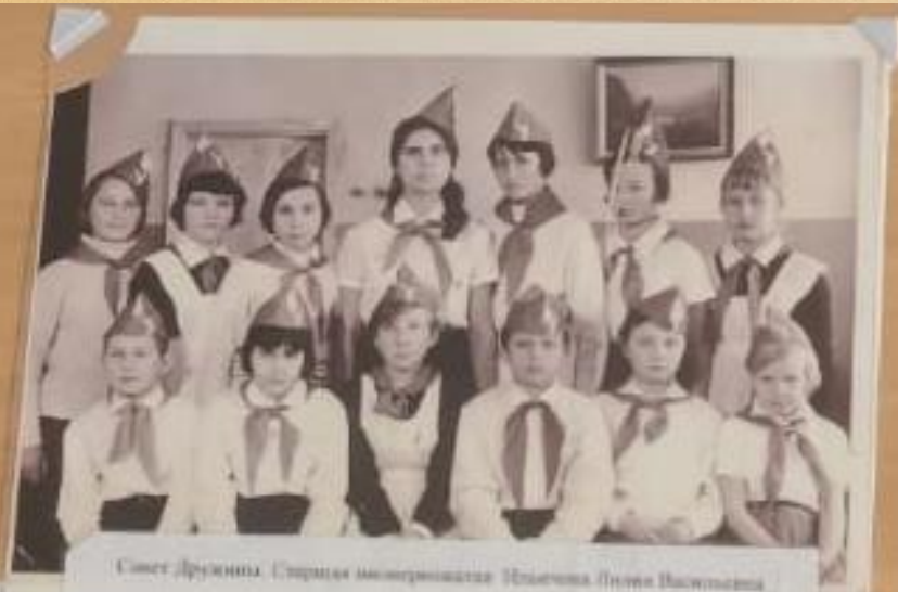
Совет Дружина. Страница измерения. Платформа. Огонь. Височина