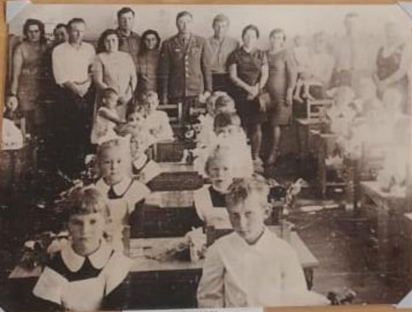
1 сентября 1971 года