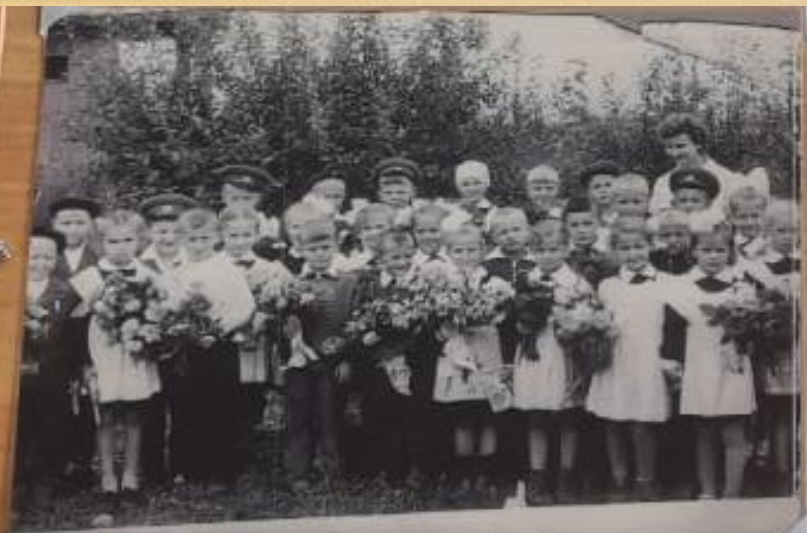
• Торжественная линейка, посвященная 1 сентября. После построения ребят волонтеры проехали по первой асфальтовой дорожке в саратовском. Далее дети прошли к давно начавшимся классам, которые располагались на краю поля возле водонапорной башни.