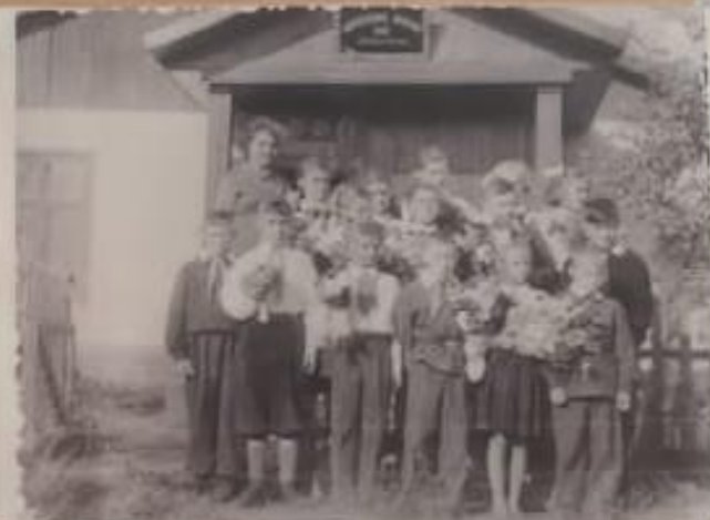
• Сентябрь 1963 года За спинами детей виден здание начальных классов Калининской общеобразовательной школы № 17.