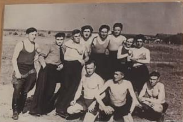
Они приехали служить на пустое место (за спинами – инерция будущего с Калинин), и только появление женщины, в лице их будущих жён, заставило расти социальную инфраструктуру военного городка