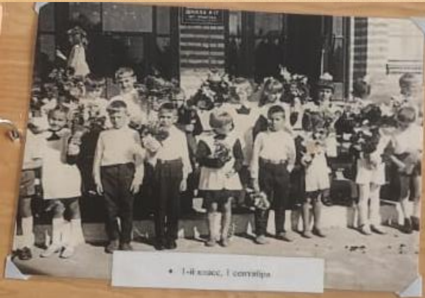
• 1-й класс, 1 сентября